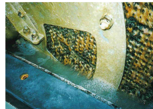
立体格子状接触体