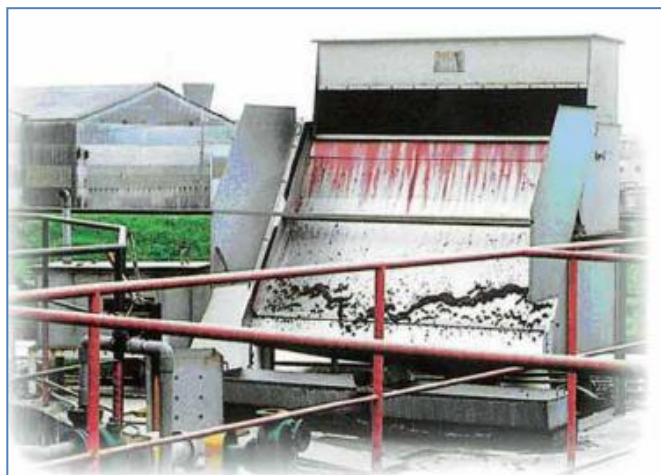
染色排水での使用例