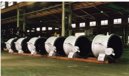
チルチング逆止弁