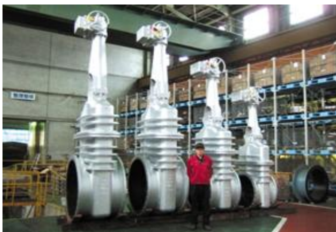
ゲート弁、組立風景