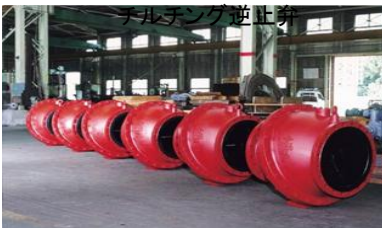
マルチディスク逆止弁