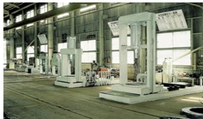
水圧・空圧試験装置