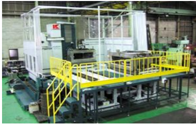
NC 横中ぐり盤(オートマチック パレットチェンジャー付)