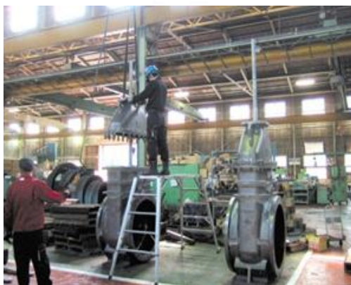
ゲート弁、組立風景