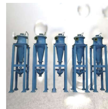
サンドセパレータ