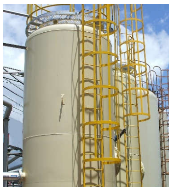
多機能型ろ過装置 オールinフィルター