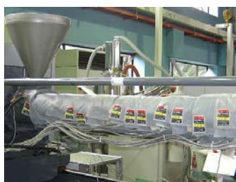
エコカバーによる成形機ヒータ省エネ