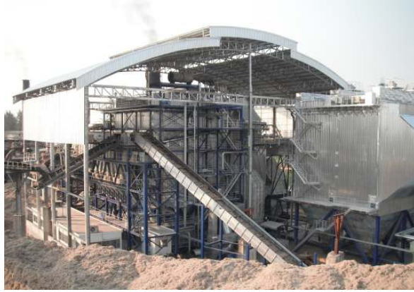
バガス焚ボイラプラント タイ