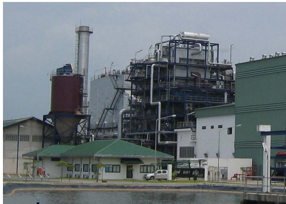
ラバーウッド焚ボイラプラント 23,000 kW