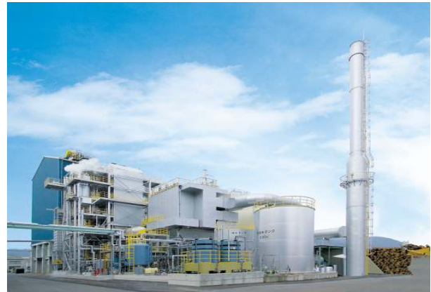
廃木材焚ボイラプラント 広島県、日本 5,000 kW