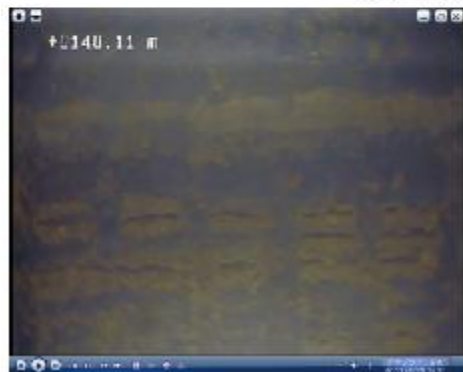
水アカ・スケールが付着