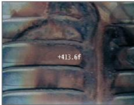
サイドビュー Side View