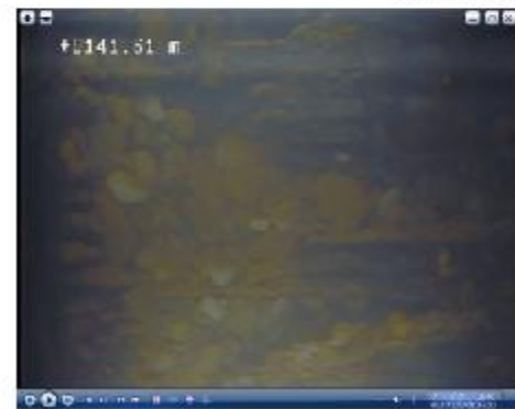
スクリーン破損により砂利が露出